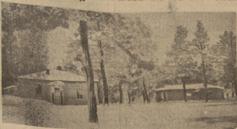
Sarıkamışın karlar ve çamlar altındaki bir manzarası

Karaköse, 10 — Üç gün evvel başlayan kar ve tipi bugüne kadar devam etmiştir. Erzurum-Beyazıt postası Tahir geçidinde müdhiş bir tipiye uğramış Tahir karakolu efradının yardımı ile kurtarılmış ve posta üç gün gecikmiştir. Dört gün süren fırtına yüzünden yol arda bulunan birçok kimseler büyük güçlüklerle tehlikeden kurtulabilmişlerdir.