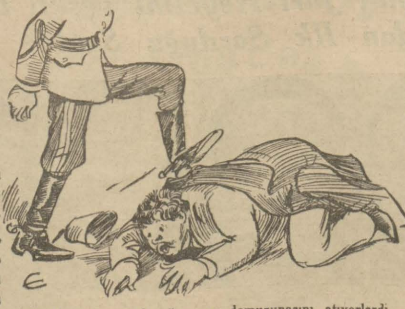
Vehbiye; kaput dayağının en domuzunasını atıyorlardı

Kararı verdiler, bir saat kadar geçtikten sonra, hatunlar orta kattaki oturma odalarında, sabah kahvaltılarını ederlerken, Tahsin, bir bahane ile yukarı çıkacak, kimseye duyurmadan, Vehbinin kapısını vurup yanına girecek; bu sözleri söyleyecek; planı tamamlayacak.