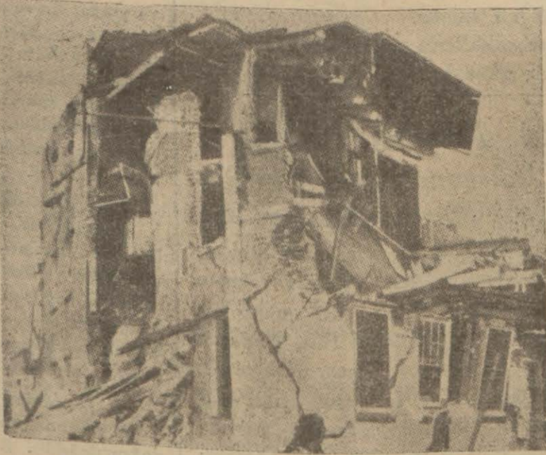
Bir zelzelede her tarafı çatlayıp yıkılmış Ev

Bandırma, 10 (Hususi) — Son zelzelelerin Erdek havalisinde yaptığı çok korkunç tesirler hakkında yeni haberler almıyor. Zelzelelerin en fazla hükmü sürdüğü Marmara Adasında sarsıntı günü saat beşi çeyrek geçe, hiçbir sallanma hissedilmediği halde, toprak çöküntüsünü andırır ve