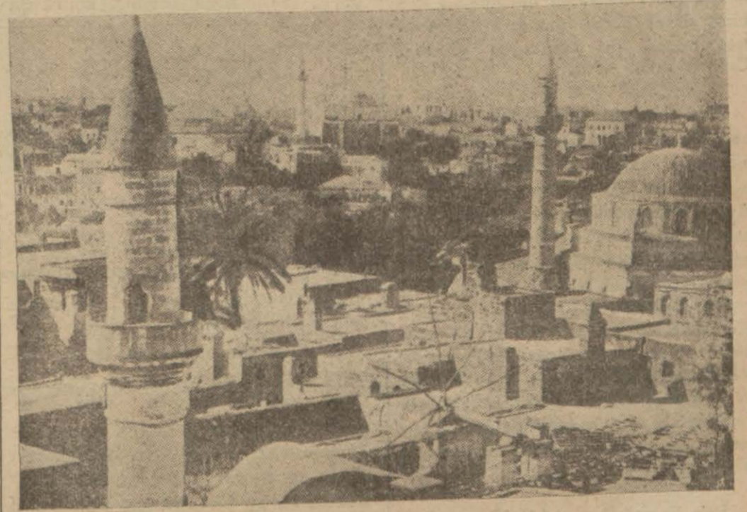
On iki adanın kraliçesi güzel Rados

“On İki Ada İtalyanın Hiç Bir İşine Yaramaz. Buradan Çekilmelidir!,,