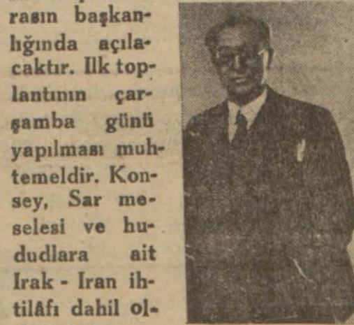
Tevfik Rüştü Aras

Cenevre, 10 (A. A.) — Uluslar konyesinin 11-1 devresi Tevfik Rüştü Arasın başkanlığında açılacaktır. İlk toplantının çarşamba günü yapılması muhtemeldir. Kensey, Sar meselesi ve hududlara ait Irak - İran ihtilâfı dahil olduğu halde, otuz kadar meseleyi tedkik edecektir.