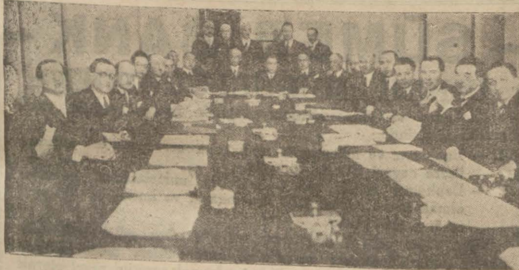
Balkan antantı devletlerinin son Atina toplantısından bir görünüş

Görüşmeler Çok Dostça Oldu Ve Altı Mühim Protokol Hazırlandı