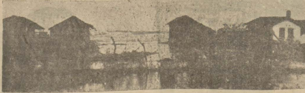
Samsunda İrmak mahallesinden bir görünüş; Evlere su girmiş vaziyette

Karadenizden korkmıyanlar, Karadeniz kıyılarının gözü pek çocuklarıdır. Onlar küçücük takaları ile bu korkunc denizin kudurmuş dalgalarını yenmeye çalışırlar ve bunda muvaffak olurlar. Sahilden sahile bir küçük taka ile dolaşan Karadeniz çocukları artık o dağ gibi dalgalar ile ünsiyet peyda etmişlerdir. Son sistem büyük gemiler kaçacak sahil, barınacak liman ararlarken dağ gibi dalgaların üzerinde bir